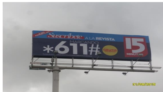
VISTA PANORÁMICA Y DE LA PUBLICIDAD CL. 26 No. 23 - 52 SENTIDO ESTE-OESTE